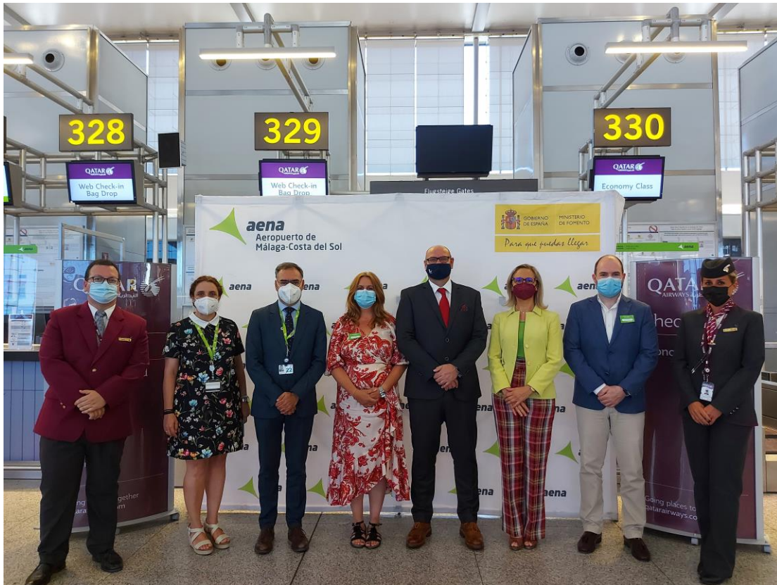
Un momento de la apertura de los mostradores de facturación para el primer vuelo de salida.