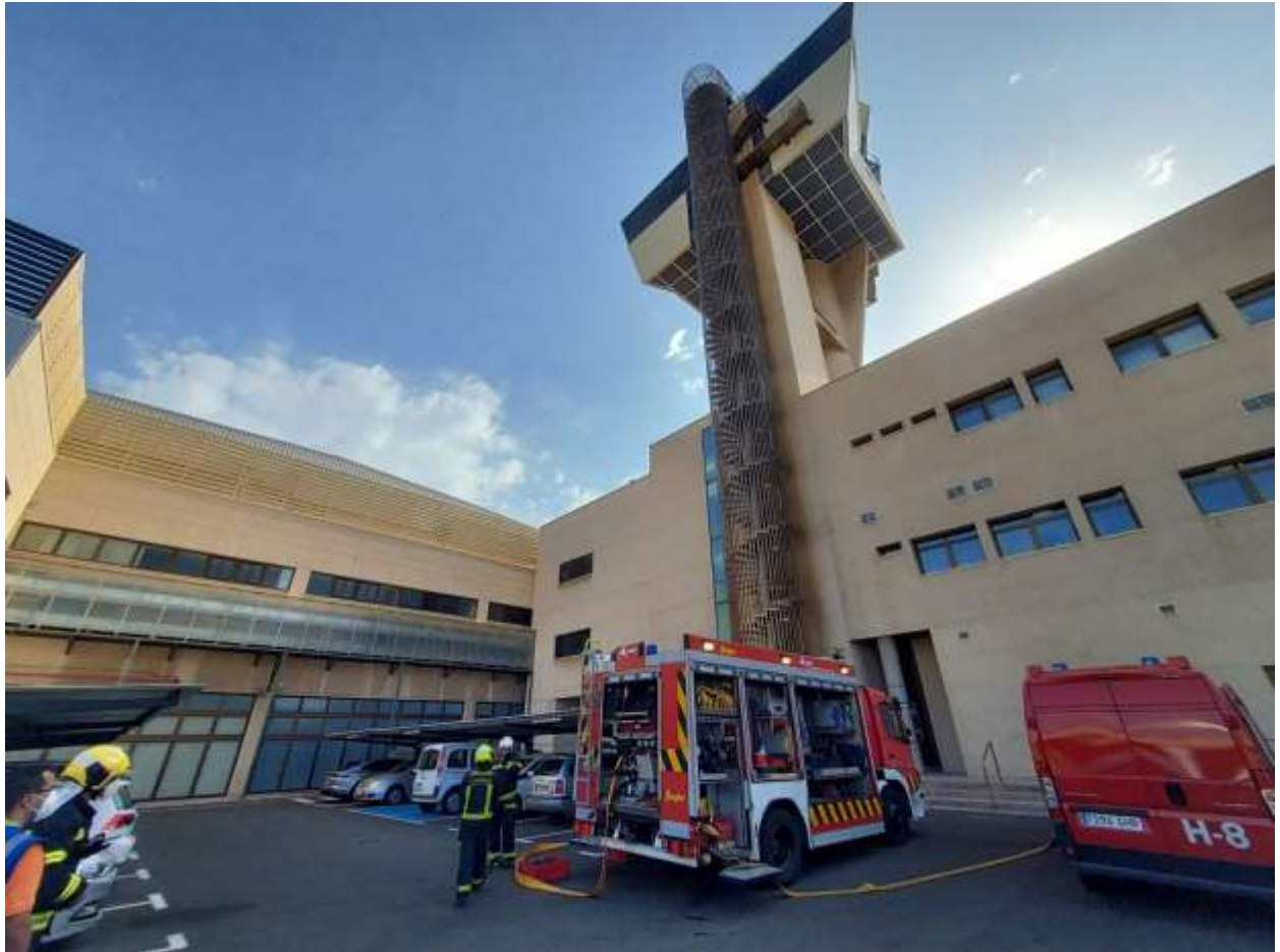
Bomberos del Aeropuerto de Gran Canaria participan en el simulacro.